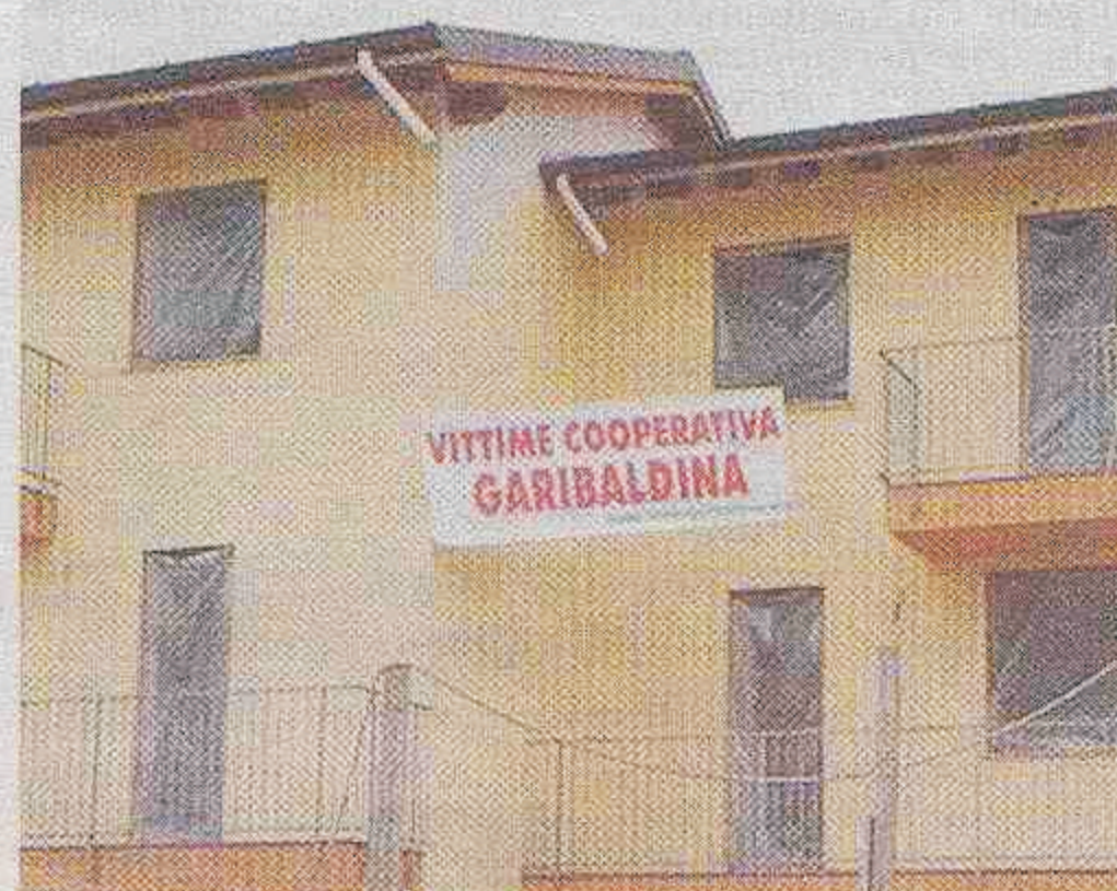
Alcune abitazioni edificate dalla «Garibaldina» ma non più ultimate